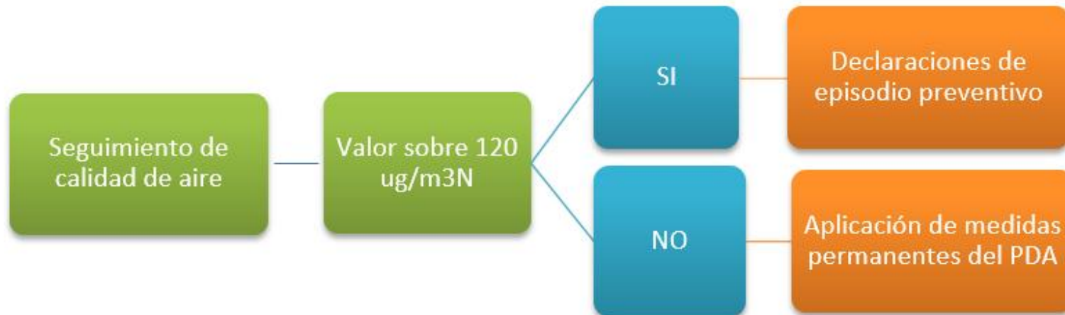
Figura 2 – Declaración de Episodio Preventivo

Del seguimiento de la calidad de aire a través de las estaciones monitoras en línea, puede dar lugar a la declaración de episodio preventivo, por parte de la Seremi del Medio Ambiente, debiéndose aplicar las medidas señaladas en el Plan de Contingencia de las CM Teck CDA y CM Dayton, más las actividades señaladas en el capítulo V del DS N°59/2014.